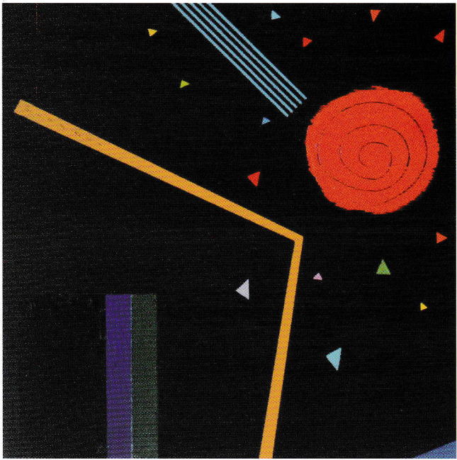
始まりの時間 油彩+アクリル板 30×30cm